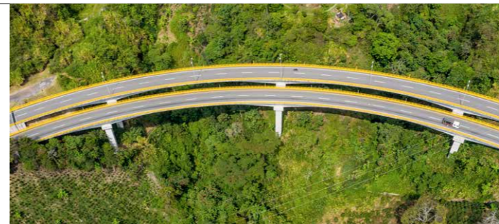
Autopistas del Café Eje Cafetero, Colombia