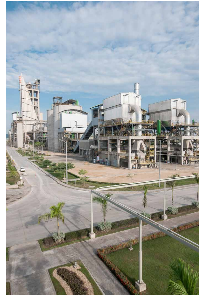
Planta Cementos Argos Cartagena, Colombia